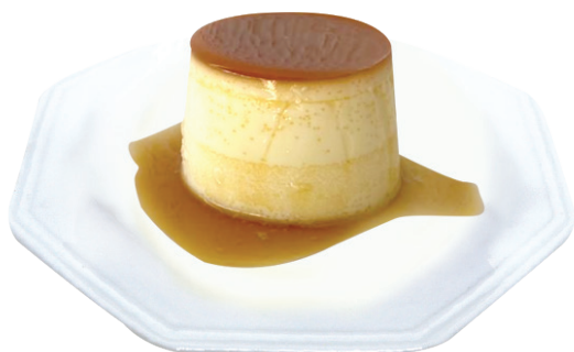
Pudim Pudim de leite clássico