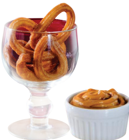
Churros 6 unidades serve 2 pessoas.