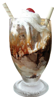
Chokolamour Chocolate ou Creme. Caldas: Chocolate ou Framboesa