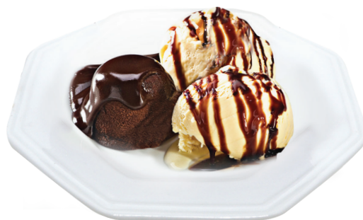
Petit Gateau Bolo de chocolate com casquinha crocante e recheio cremoso, servido com sorvete de creme