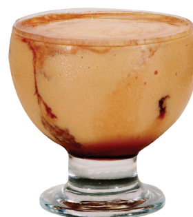
Creme de Papaia Papaia servido com sorvete de creme